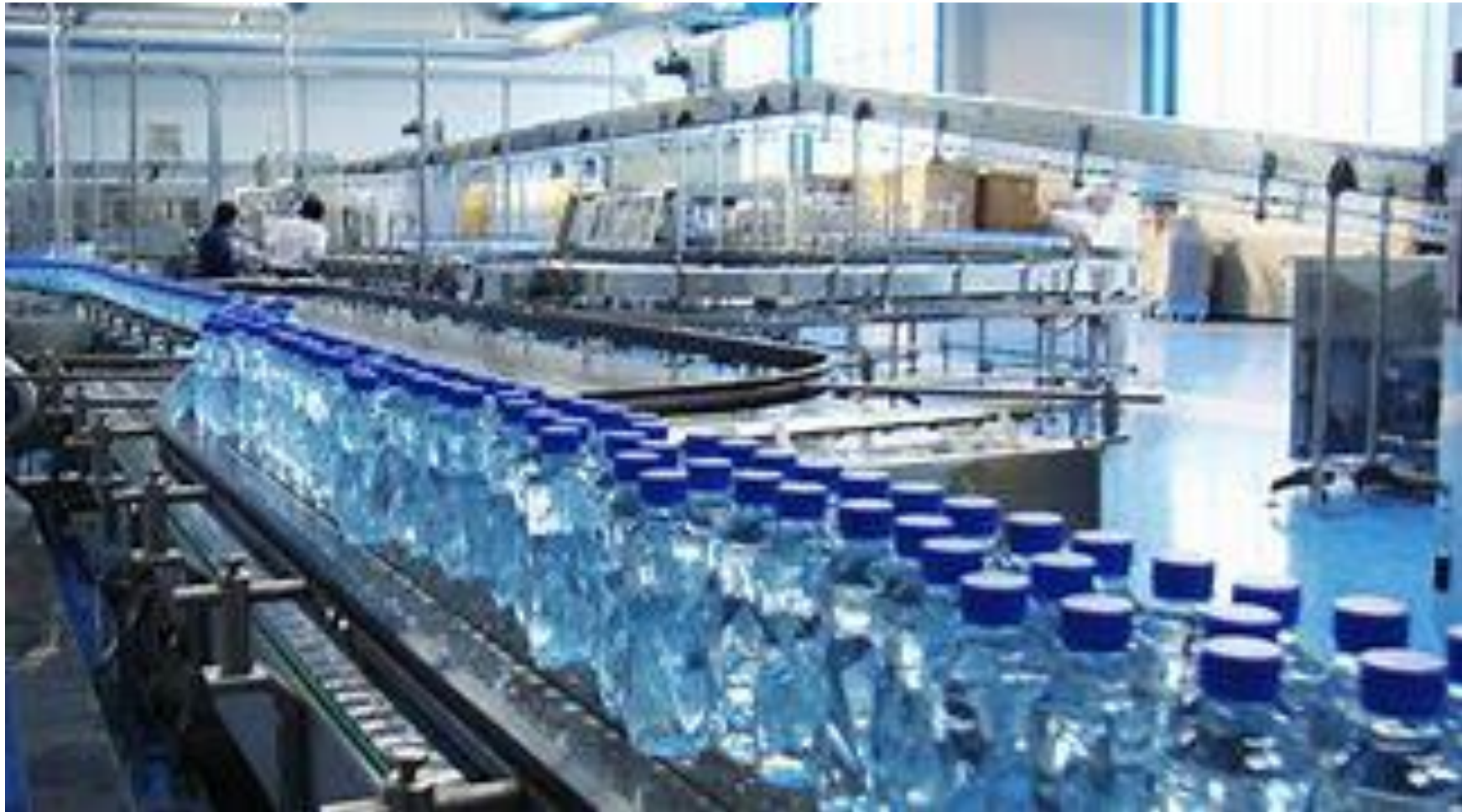
Usine d'embouteillement Volvic