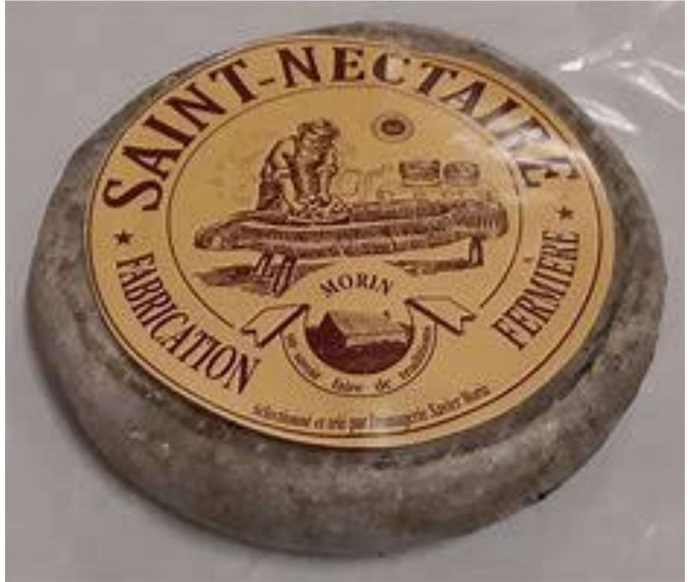
Visite d'une fromagerie : découverte de la fabrication artisanale du Saint-Nectaire