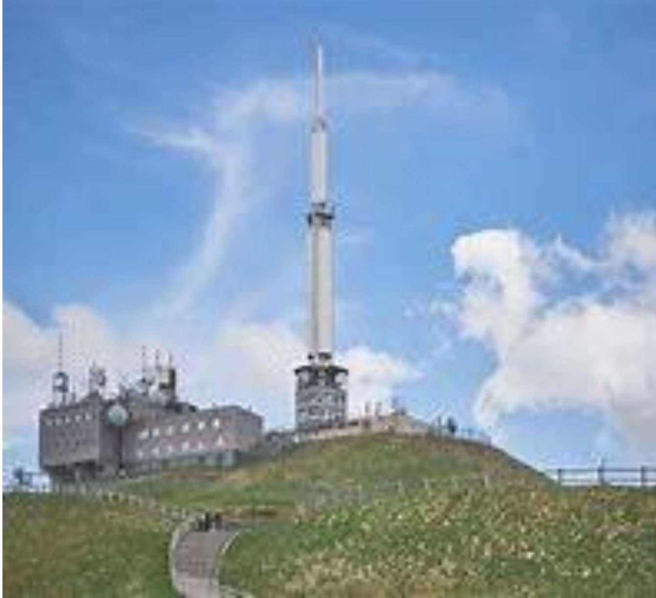
Station météorologique - Puy de Dôme