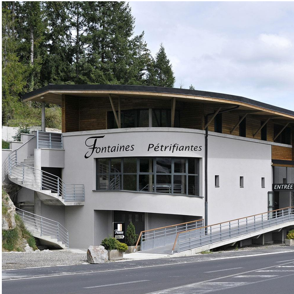
Musée des Fontaines pétrifiantes - ateliers de fabrication d'objets en calcaire